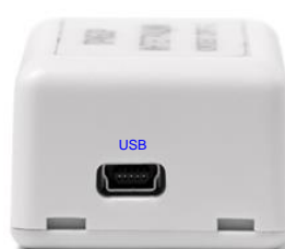
Разъём интерфейса USB