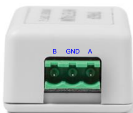
Разъём интерфейса RS-485